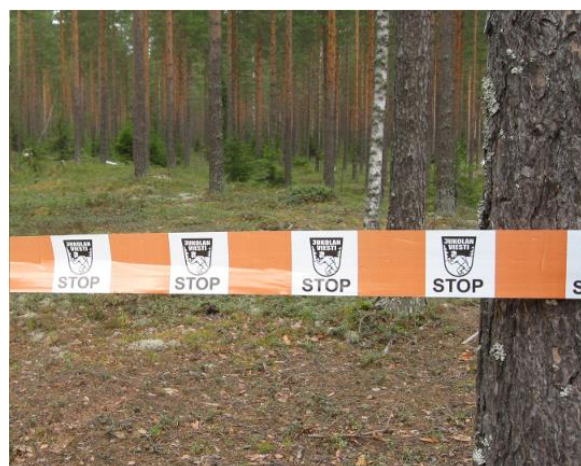
Mallikuva kielletyn alueen nauhasta

Kilpailualueella on ennallistettu suoalue, joka on ylipääsemätön ja turvallisuussyistä merkitty kielletyksi alueeksi. Pistepellot ja piha-alueet ovat kiellettyjä alueita. Muut kielletyt alueet on merkitty kilpailukarttaan pystyviivoituksella ratapainatusvärillä. Jos kielletyn alueen reunassa on yhtenäinen viiva, niin maastossa on vastaavalla kohdalla yhtenäinen kielletyn alueen nauha. Kielletyt tiealueet on merkitty pystyviivoituksella ratapainatusvärillä. Maastossa on yksittäisiä, pieniä kiellettyjä alueita (esim. linnunpesiä), jotka on merkitty maastoon kielletyn alueen nauhalla.