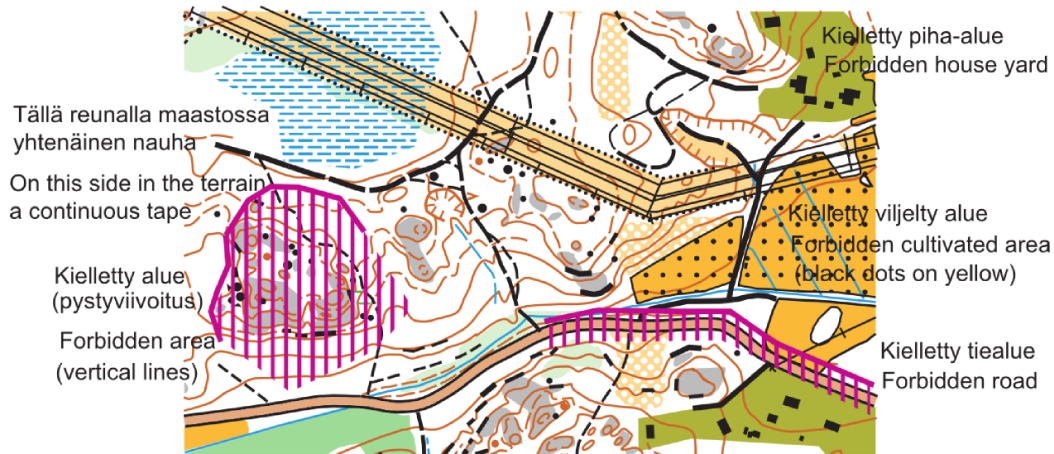
Mallikuva kielletyn alueen merkinnöistä.

Kyseisiä alueita ei ole merkitty karttaan kielletyn alueen merkinnällä.