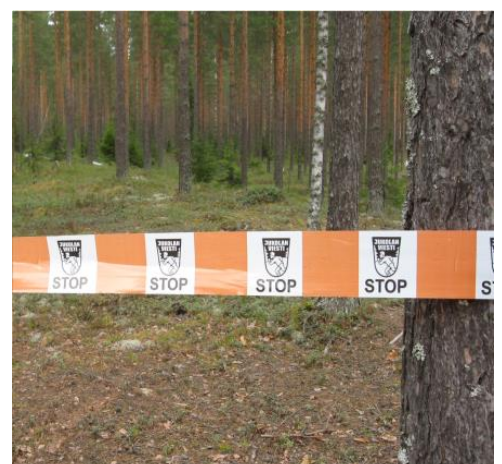
Modell för snitsel som anger förbjudet område.

På tävlingsområdet finns en återuppbyggd myrmark som är opasserbar och markera d som förbjudet område av säkerhetsskäl. Punktmarkerade åkrar samt tomtmark är förbjudna områden. Övriga förbjudna områden har markerats på tävlingskartan med lodräta streck i samma färg som banan ritats på kartan. Om ett förbjudet område har avgränsats med ett oavbrutet streck motsvaras det i terrängen av heldragen snitsling. Förbjudna vägområden har markerats med lodräta streck. I terrängen finns enstaka små förbjudna områden (t.ex fågelbo) som är markerade med heldragen snitsling. Dessa områden har ej markerats på kartan med förbjudet tecken. Modell för snitsel som anger förbjudet område finns vid modellkontrollen.